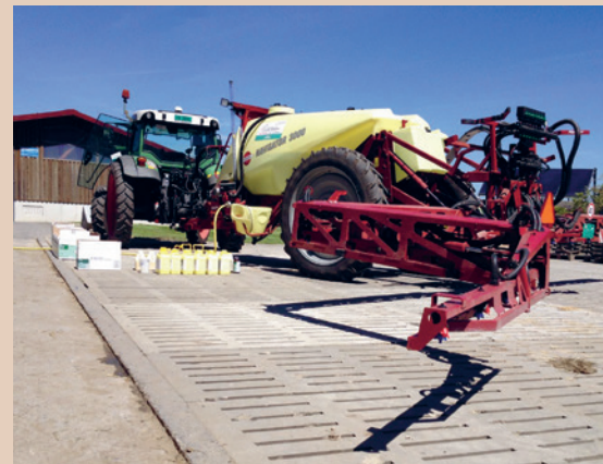
Nettoyage d'un pulvérisateur sur un site disposant d'un écoulement vers une fosse à purin active, St. Berger