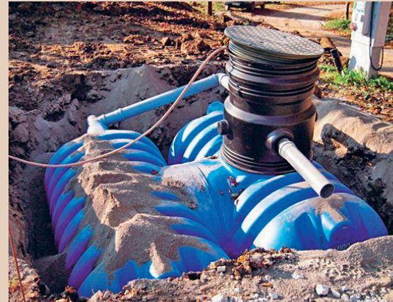
Une cuve de rétention enterrée est à l'abri du gel, mais elle doit impérativement être équipée de doubles parois, L. Chevalier

Fosses à purin inutilisées: une fosse à purin qui n'est plus utilisée est en général verrouillée et il n'est pas permis d'y entreposer de l'eau de rinçage. Elle ne satisfait pas aux prescriptions légales réglant le stockage des liquides pouvant altérer les eaux (double paroi).