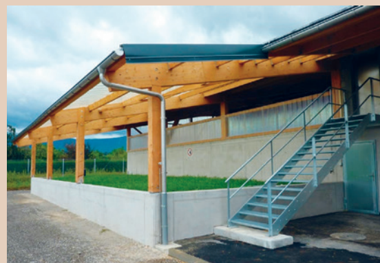
Biobac de l'installation collective de Dardagny, AGRIDEA

Utilité: pour un nombre restreint de lavages ou le nettoyage annuel du pulvérisateur avant l'hivernage.