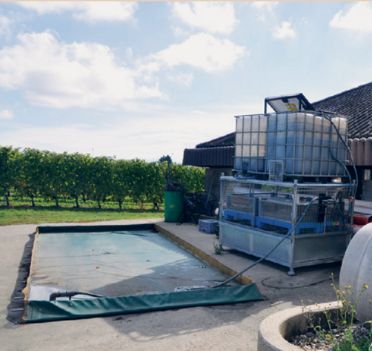
Poste de nettoyage mobile avec système Osmofilm à Marcelin, M. Hochstrasser