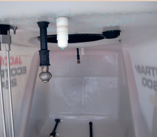
Cuve de pulvérisateur avec buse de rinçage intérieure, agrotop