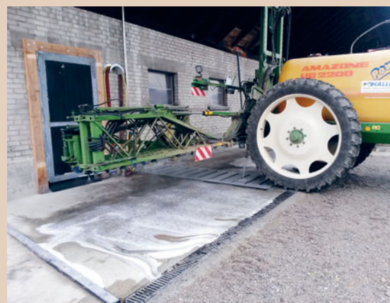
Poste de nettoyage aménagé sous un avant-toit avec grille de drainage, Th. Haller