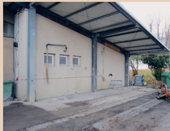
Poste de remplissage du pulvérisateur avec potences et grilles de drainage à Bavendorf (D)

Utilité : pour des exploitations devant souvent remplir et nettoyer le pulvérisateur.