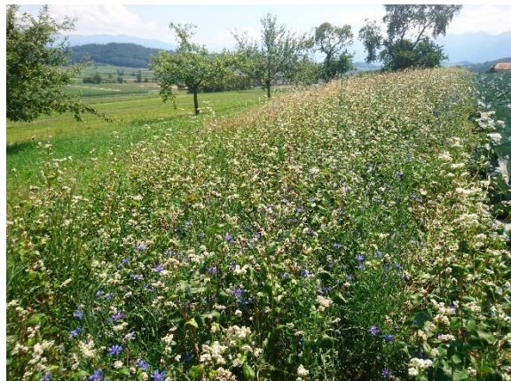
Figure 3 : Bandes semées pour organismes utiles dans une culture de choux.

*** Selon les PER, une pause de 2 ans au même endroit s'applique aux bandes semées pour organismes utiles, comme pour les autres grandes cultures.